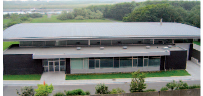
Rhepanol fk: voelt zich thuis op alle daken over de hele wereld