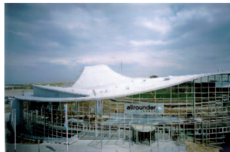
Rhepanol fk: voor platte daken van allerlei vormen.